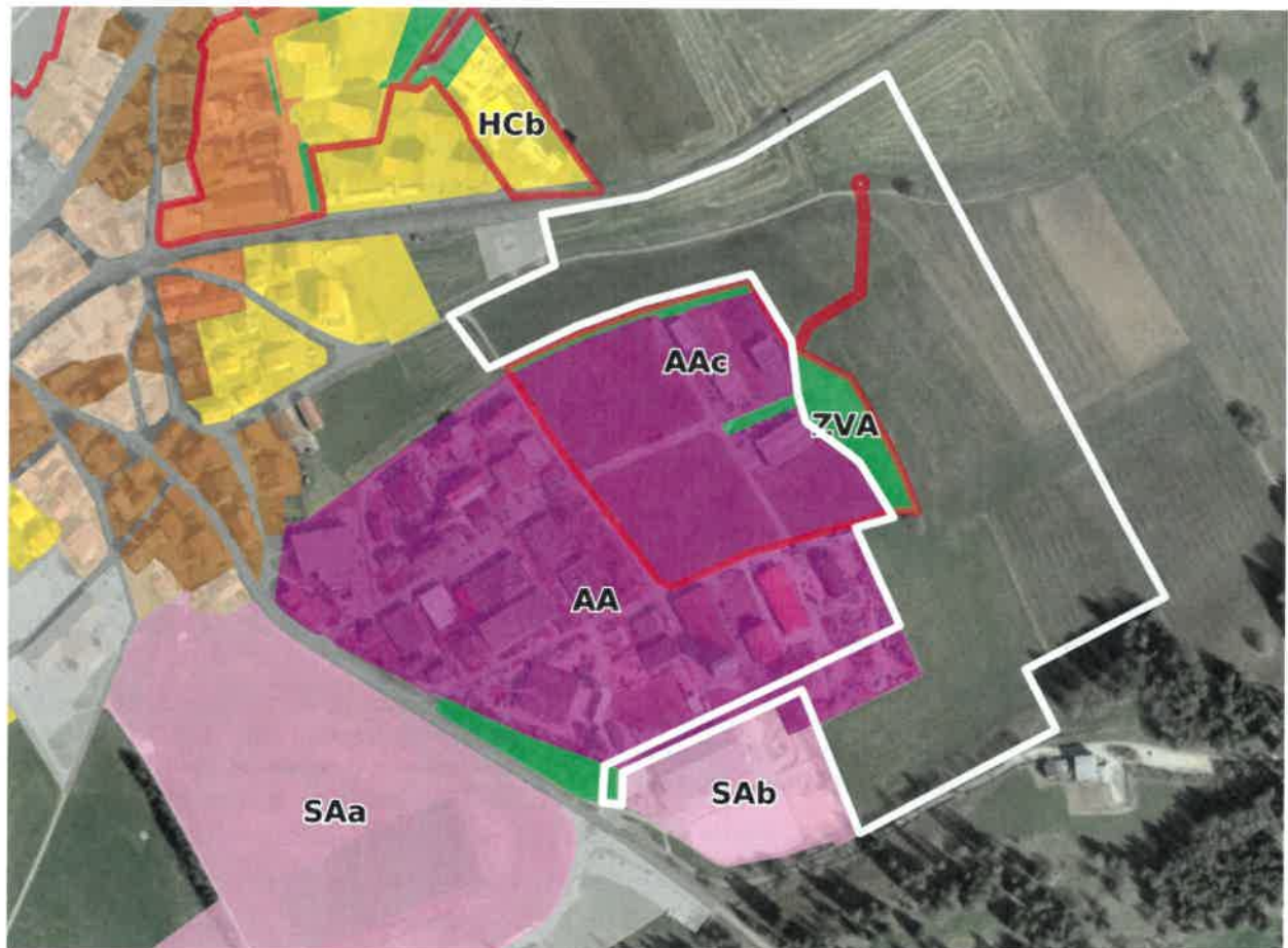
Figure 1 : Aperçu de la zone d'activités communale et du périmètre de planification (en blanc) de la zone AIC (Source : Géoportail du SIT-Jura, avec l'orthophoto 2017 et selon l'état des données à octobre 2020).

Le périmètre de planification de la zone AIC de Saignelégier est contigu à la zone d'activités communale (zone AA et zone AAc avec plan spécial en vigueur) et à la zone de sport et de loisirs (SAb « manège »). Il s'étend sur une superficie d'environ 11 hectares.